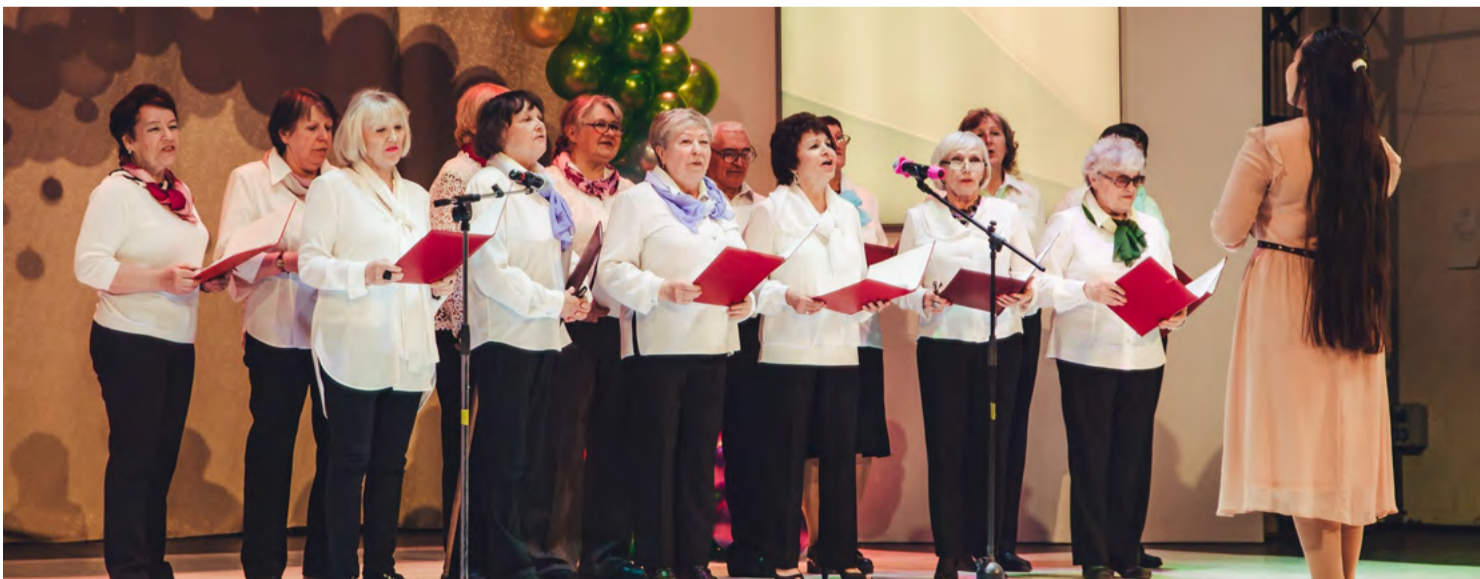
Выступление хора «Северное Сияние» на отчетном концерте

По профессии я – инженер-строитель, но всегда была творческим человеком. Я шила, одевала себя и ребенка, вязала, занималась макраме, фриволите. Так что любовь к творчеству была у меня всегда.