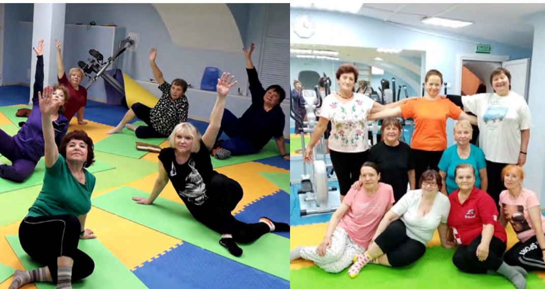
Занятия в кружке стретчинг