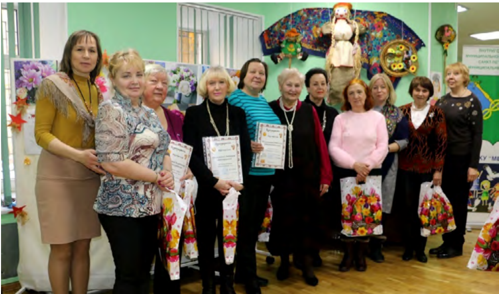
Конкурс «Солнечный блин»

У нас вы непременно найдете себе увлечение по душе!