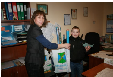
Конкурс «Я творю...»

Условия конкурса не предполагали каких-либо ограничений или творческих рамок - ребята могли сами выбрать направление для творчества, будь то чтение стихов, пение, рисование, лепка, аппликация, конструирование и другое. Широту творческих устремлений наших детей можно наглядно увидеть по представленным работам. В конкурсе не было победителей, главное – не было проигравших. Все дети получили подарки, которые, в свою очередь, сами послужат основой для развития детских и подростковых творческих способностей.